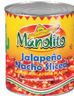
JALAPENO PASTRY CZERWONE gramatura ilość szt. w op. 2900g 6