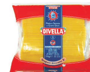
SPAGHETTI RISTORANTE gramatura ilość szt. w op. 5000g 3