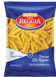
PENNE ZITI RIGATE gramatura ilość szt. w op. 500g 24