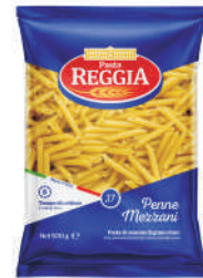
PENNE MEZZANI gramatura ilość szt. w op. 500g 24