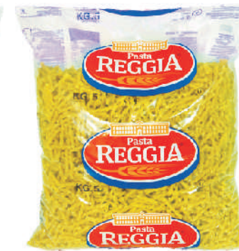
GEMELLI gramatura ilość szt. w op. 5000g 3