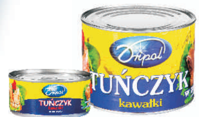
TUŃCZYK KAWAŁKI ZALEWA