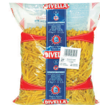
PENNE ZITI RIGATE gramatura ilość szt. w op. 5000g 3