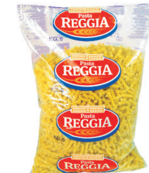
FUSILLI gramatura ilość szt. w op. 5000g 3