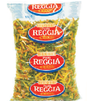
FUSILLI TRICOLORE gramatura ilość szt. w op. 5000g 3