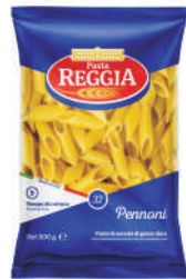
PENNONI gramatura ilość szt. w op. 500g 24