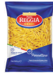
PENNETINI gramatura ilość szt. w op. 500g 24