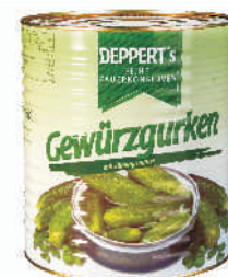
OGÓRKI KONSERWOWE 100/110 gramatura ilość szt. w op. 9700g 1