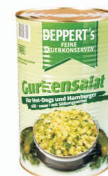
OGÓRKI KONSERWOWE KOSTKA gramatura ilość szt. w op. 9700g 1