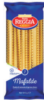
MAFALDE gramatura ilość szt. w op. 500g 24