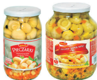
PIECZARKI MARYNOWANE CAŁE gramatura ilość szt. w op. 750g 8 1600g 6