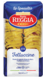
FETTUCINE gramatura ilość szt. w op. 500g 24