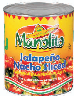
JALAPENO PASTRY 3-KOLORY gramatura ilość szt. w op. 2900g 6