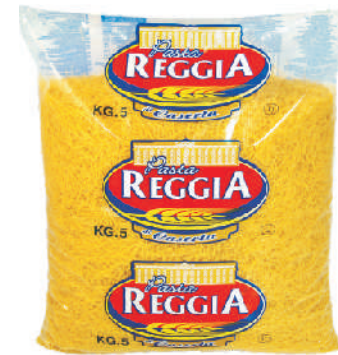
SPAGHETTI TAGLIATELE gramatura ilość szt. w op. 5000g 3