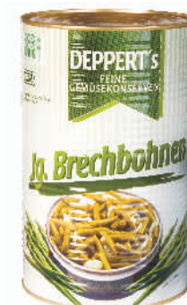
FASOLKA ZIELONA gramatura ilość szt. w op. 4000g 1