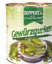
OGÓRKI KONSERWOWE 80/75 gramatura ilość szt. w op. 9700g 1