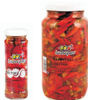
PAPRYKA PIRI-PIRI gramatura ilość szt. w op. 100g 12 900g 6