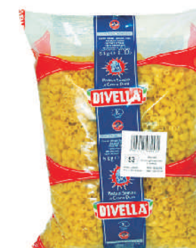
GOMITI gramatura ilość szt. w op. 5000g 3