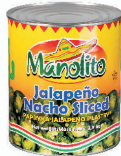
JALAPENO PASTRY ZIELONE gramatura ilość szt. w op. 2900g 6