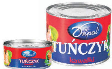
TUŃCZYK KAWAŁKI OLEJ