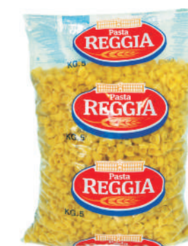
GOMITI RIGATE gramatura ilość szt. w op. 5000g 3