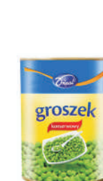
GROSZEK KONSERWOWY gramatura ilość szt. w op. 400g 12 2500g 1