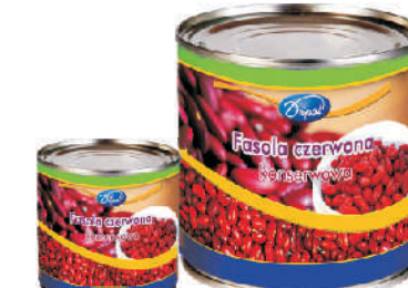
FASOLA CZERWONA gramatura ilość szt. w op. 400g 24 2500g 6