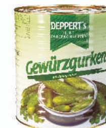
OGÓRKI KONSERWOWE 40/45 gramatura ilość szt. w op. 9700g 1