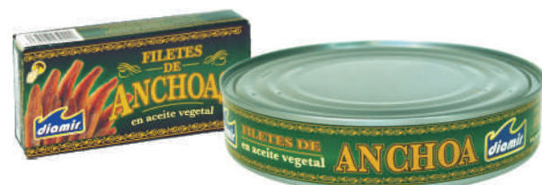
FILETY ANCHOA W OLIWIE