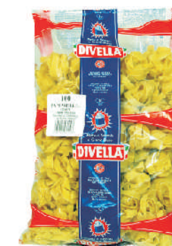
PAPPARDELLE gramatura ilość szt. w op. 3000g 2