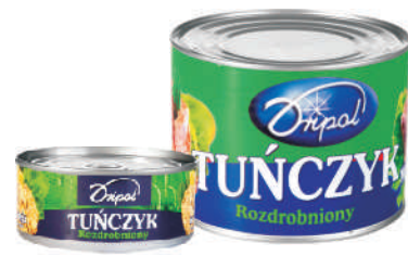
TUŃCZYK ROZDROBNIONY OLEJ