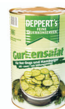
OGÓRKI KONSERWOWE PASTRY gramatura ilość szt. w op. 4300g 1