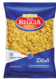
DITALI gramatura ilość szt. w op. 500g 24