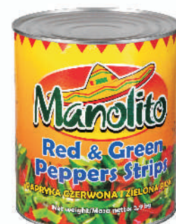
PAPRYKA CIĘTA 2-KOLORY gramatura ilość szt. w op. 2900g 6