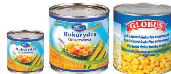
KUKURYDZA KONSERWOWA gramatura ilość szt. w op. 340g 10 2650ml 2 2650ml 3