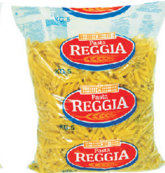
PENNE ZITI RIGATE gramatura ilość szt. w op. 5000g 3