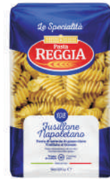
FUSILONE NAPOLETANA gramatura ilość szt. w op. 500g 24