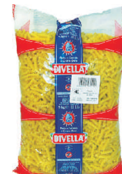
FUSILLI gramatura ilość szt. w op. 5000g 3