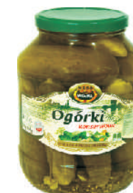
OGÓRKI KONSERWOWE gramatura ilość szt. w op. 1600ml 6