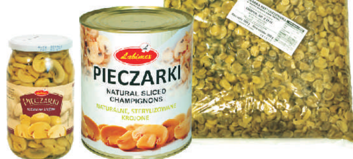
PIECZARKI KROJONE W ZLEWIE gramatura ilość szt. w op. 770g 8 2840g 1 7000g 1