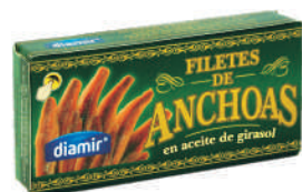
FILETY ANCHOA W OLEJU SŁONECZNIKOWYM