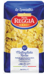
MALTAGLIATA RICCIA gramatura ilość szt. w op. 500g 24