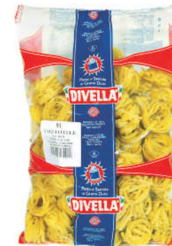
TAGLIATELLE gramatura ilość szt. w op. 3000g 2