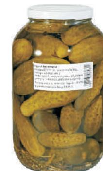
OGÓRKI KONSERWOWE gramatura ilość szt. w op. 3720ml 2