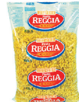
CAVATAPRI gramatura ilość szt. w op. 5000g 3