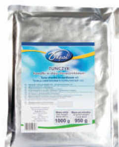
TUŃCZYK W OLEJU VACUM