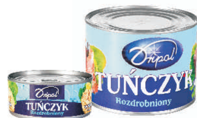
TUŃCZYK ROZDROBNIONY ZALEWA