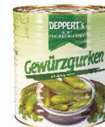
OGÓRKI KONSERWOWE 55/66 gramatura ilość szt. w op. 9700g 1