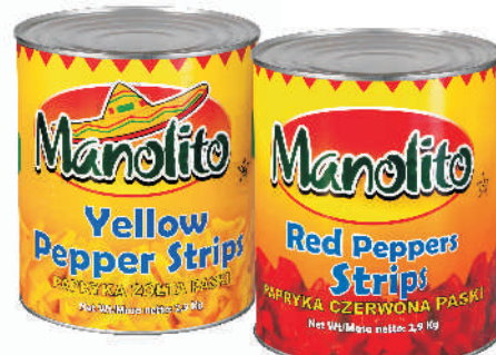
PAPRYKA CIĘTA -ŻÓŁTA, -CZERWONA gramatura ilość szt. w op. 2900g 6 2900g 6