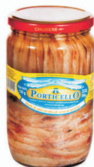
FILETY Z ANCHOA W OLEJU