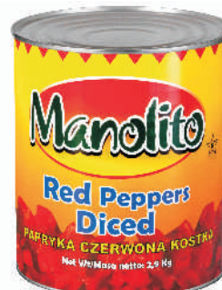
PAPRYKA CZERWONA KOSTKA gramatura ilość szt. w op. 2900g 6