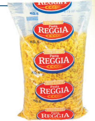
FARFALLE gramatura ilość szt. w op. 5000g 3